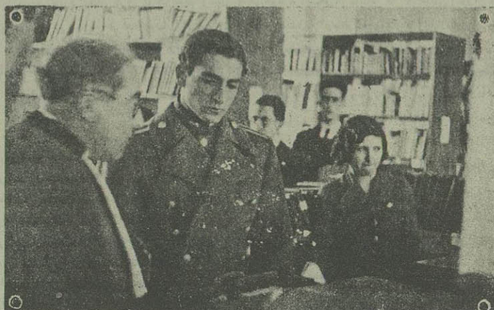
در کتابخانه دانشسرای عالی

بمدار باز دید کتابخانه بترتیب آزمایشگاه (لابراتوار) حیوان شناسی (در این موسسه والا حضرت همایونی ساعت کار دانشجویان و نتیجه تحصیلات آن