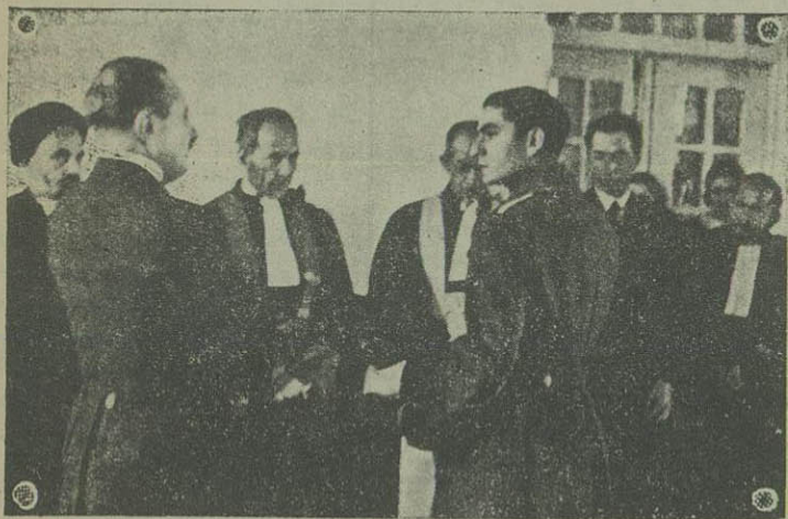
آقای وزیر معارف استادان را حضور والا حضرت معرفی می نماید