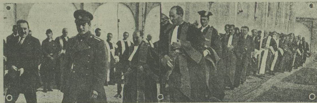
هنگامی که والا حضرت همایون ولایتعهد به دانشسرا ورود می فرمایند