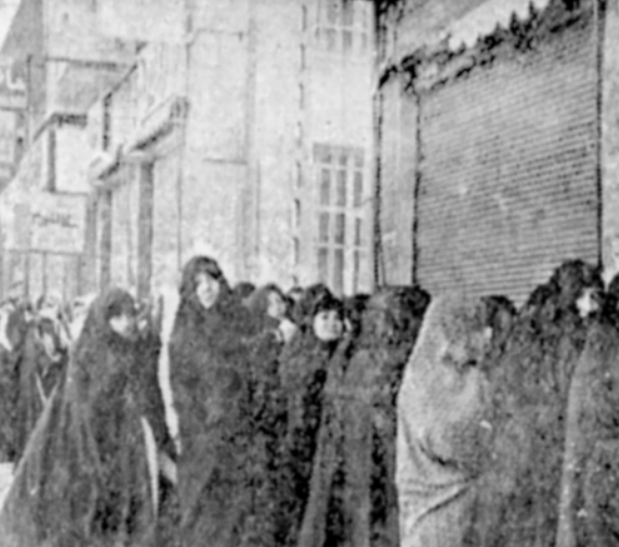
بعضی از افراد در تهران در حال رای دادن هستند.

ساعت دیروز همچنین در حوزه اخذ رای خیابان فرح واقع در محدوده خیابان حسن گروه کثیری از ساکنان خیابان فرح، آراء خود را به صندوق ریختند. در این محله هم از اهل قلوبیرون مرکز زاهدان بخش شده شرکت در چنین راهیابی ها را تحریم کرده اند. پیروان مذهبی استان متفق در این محل تیسار ضعیفانند و خلتیتری نیز آراء دادند گروهی از پزشکان نیز در همین حوزه آراء خود را به صندوق ها