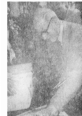
مهندس بازرگان، نخست وزیر دولتمو فتا انقلابی به جمهوری اسلامی رای میدهد

گزارش خبرنگاران اعزامی اطلاعات، از قم رهبر انقلاب و مراجع تقلید چگونه رای دادند امام خمینی پس از رفراندم مراحل دیگری در پیش داریم