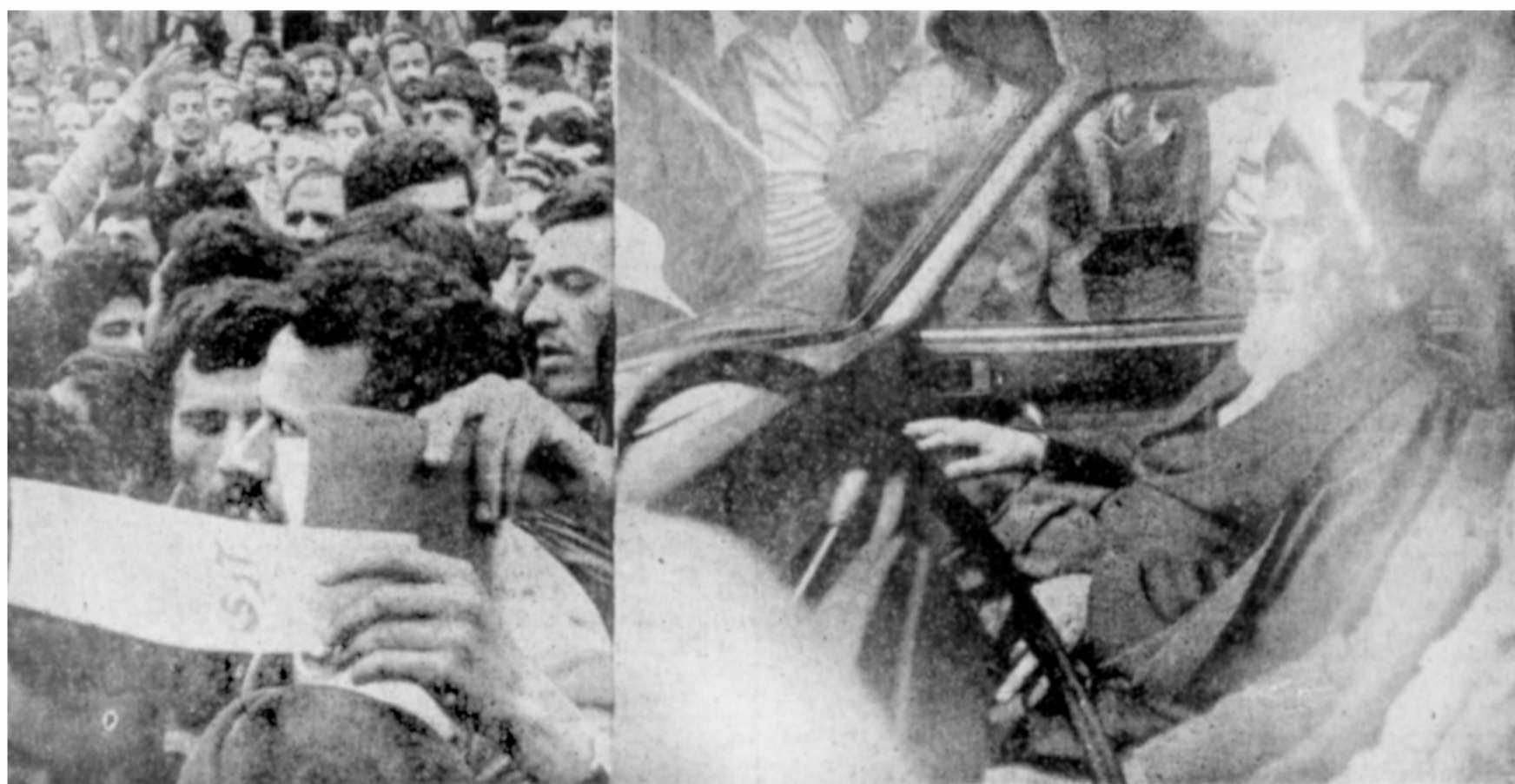
عکس اختصاصی اطلاعات اجتماع مردم قم هنگام مراجعه امام خمینی و پسرانش به حوزة مسجد چهارمردان برای دادن رای به حدی شدیدو غیر قابل کنترل بود که امام نتوانستند از انومیل پیاده شوند و ناگزیر رای آری خود را توسط جمعیت و مأموران حوزه از داخل انومیل فرستادند که بمصدق انداخته شود