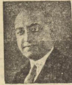
آقای فروهر قبیل وزارت داخله که بمقام وزارت نائل شده اند