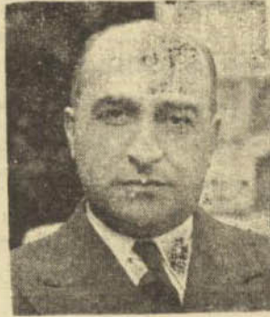
آقای محمود بدر قبیل وزارت مالیه که بمقام وزارت ارتقاء یافته اند