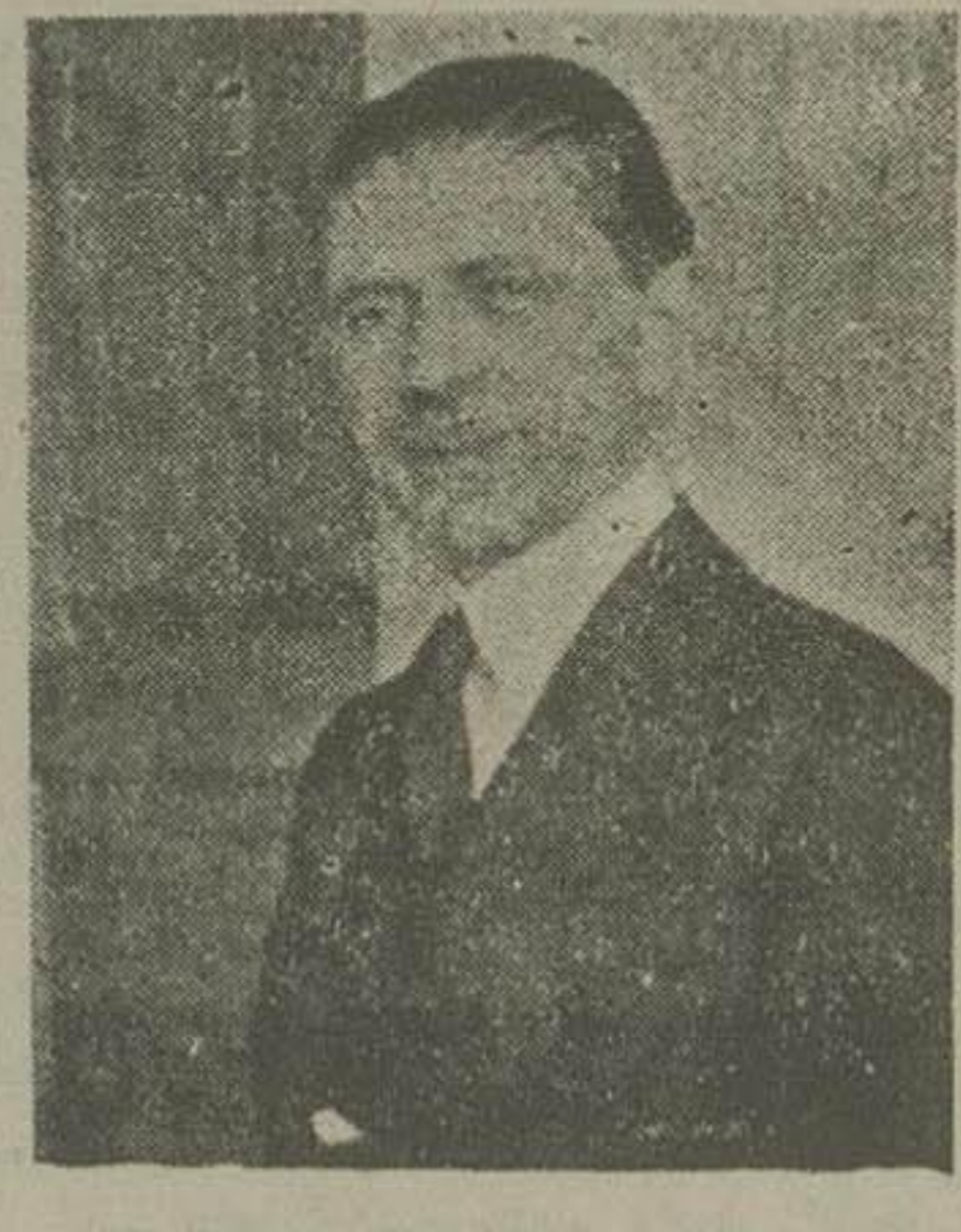
آقای فرخ وزیر صناعت و معادن