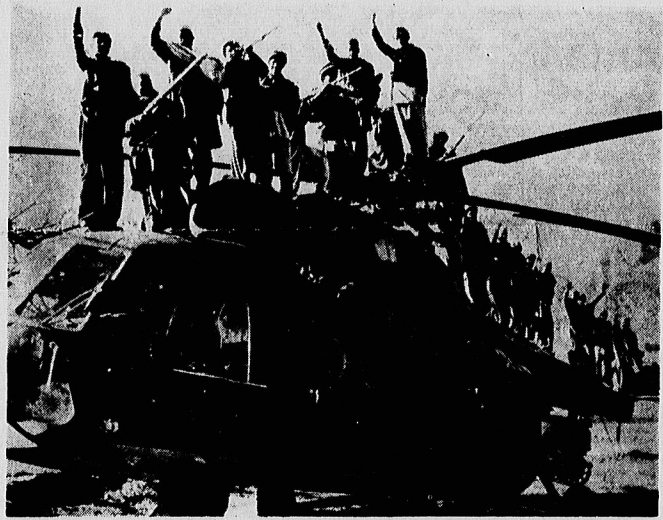
نه تنها، تانک، توپ ، مسلسل دیگر اثر ندارد، بلکه مدرنترین هواپیما ها و هلیکوپتر ها نیز بی خاصیت شده اند. مبارزان مسلحان افغانستان با یاری خدا خاطر پیروزی بردشمن خدا، بخند بر لب دارند. عکس یک هلیکوپتر نظامی مدرن روسی که بدست مبارزان مسلمان افغانستان افتاده است، نشان می دهد.

* شرکت بیمه ، در سراسر کشور فعالیت می کند * از سال آینده شرکت بیمه عمر و زندگی ایجاد می شود در صفحه ۲