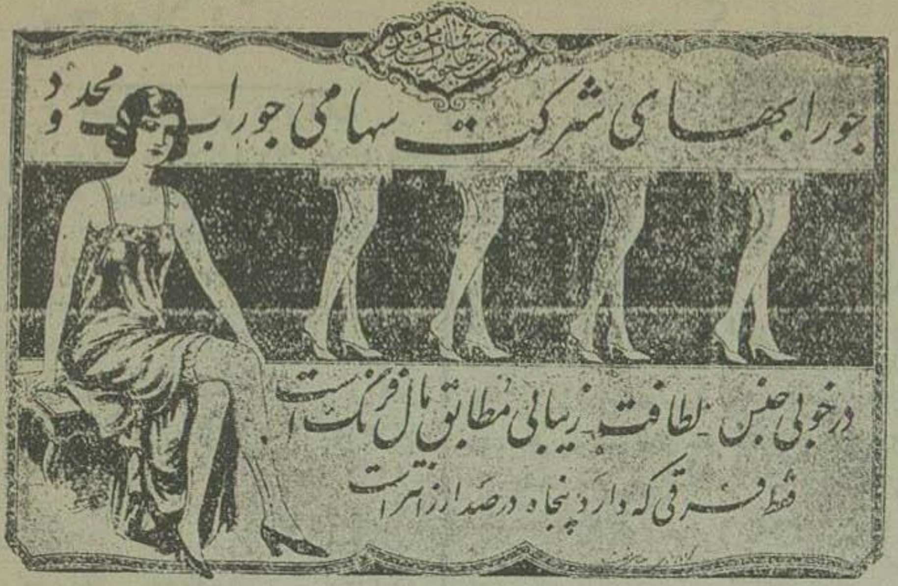
نمره اعلان ۵۱۲

مهرترین مر کب های بارسی اعلا بالاران ذیالقدر است : آبی - پیشانی - زرد - لاک - سبز - سفید - ای جمل نوع وینتبه چهار نوع زرد و سبزیتر ۳ نوع است باین ترتیب کلهور باز - قوریز تیر و قوریز متوسط - قوریز لاک همین طور الوان دیگر سفید - تیت - متوسط می باشد مطالعه ای میل داشته باشند کارهای لوکی و طرف بانک های مختلف بیرون بدهند می توانند از مر کب های جدیدی که برای مطالعه اطلاعات ریاضیات و محاسبات استناد نمایند مقداری از این نوع مخصوص ریاضیات و محاسبات برای فروش بوسیله مجامعین و سارارات از محاسبات و ریاضیات نیز قبول و انجام می شود نمره اعلان ۳۵۱