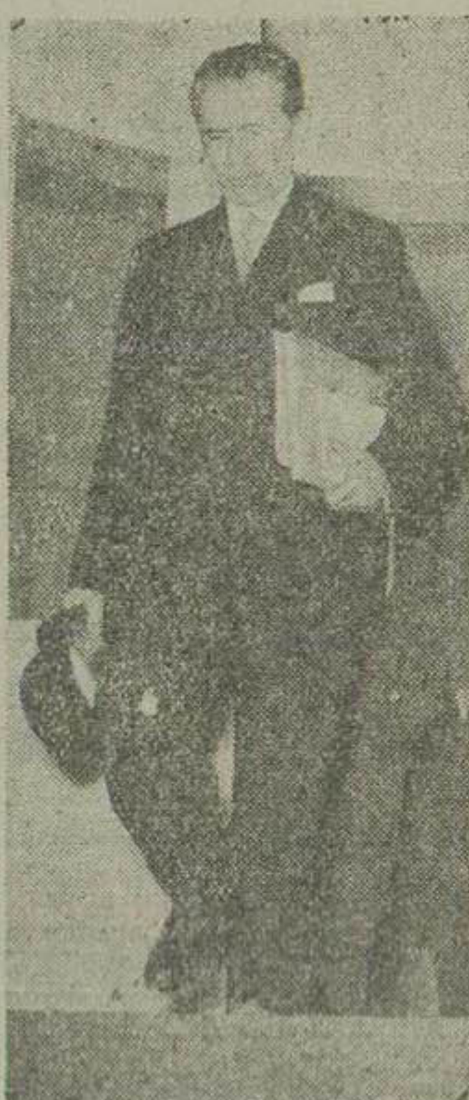
آقای نخست وزیر در حالی که پرونده مربوط به الحاق ایران...