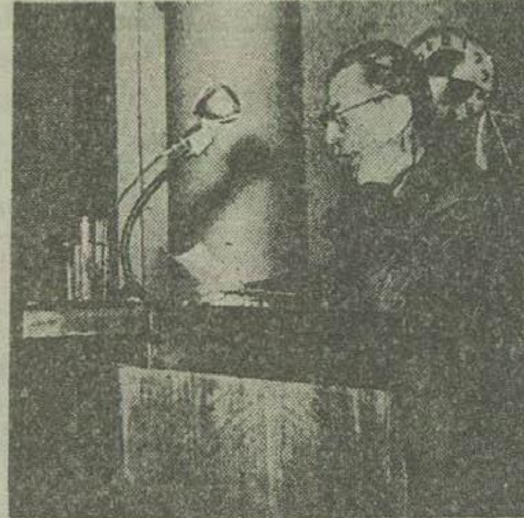
آقای علاء نخست وزیر هنگام ایراد نطق در جلسه امروز مجلس سنا

یکمسیون ارجاع شود رئیس - در غیر از آقایان اجازه نظر نداشتند ولی پیشنهاد رسیده که اگر تصویب نشد مذاکرات ادامه یابد (پیشنهاد آقای خواجه لوری در مورد اینکه لایحه یکمسیون برود قرائت شد) رئیس - آقای خواجه لوری - خواجه لوری - هیچکس مخالف با