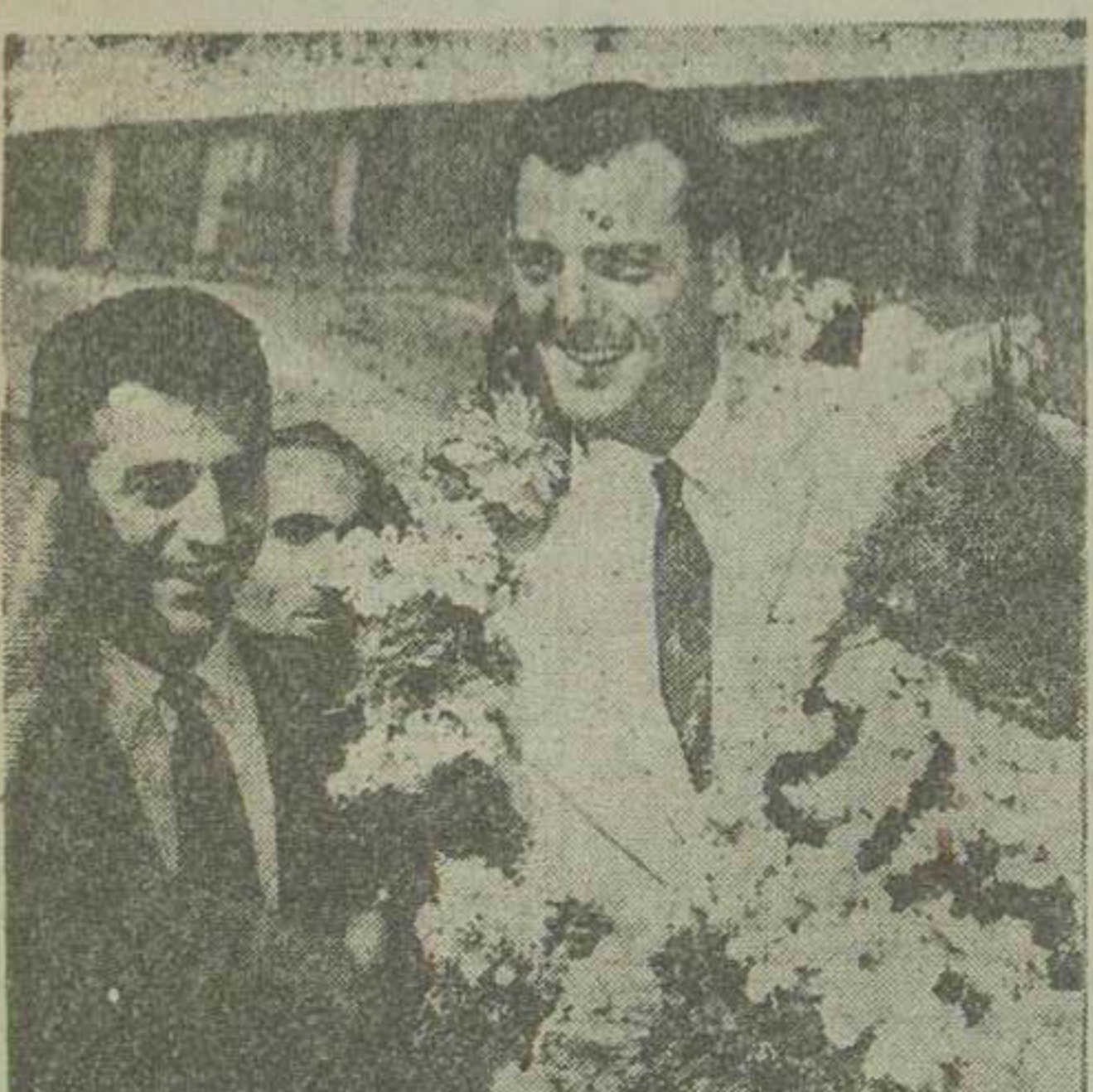
از طرف فدراسیون دو میدانی کشور دسته کلی به باب متیاس اهداشد که برای آن ماکل نوشته بودند دو میدانی