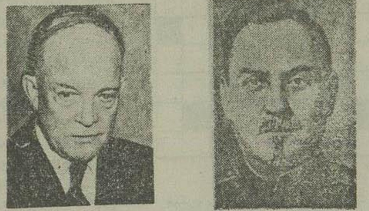
بولکانین از بیماری ایزنهاور سخنرانی است

مران شوروی بجز ایزنهاور به اغلب سیاستمداران امر بگائی مظنون می باشد