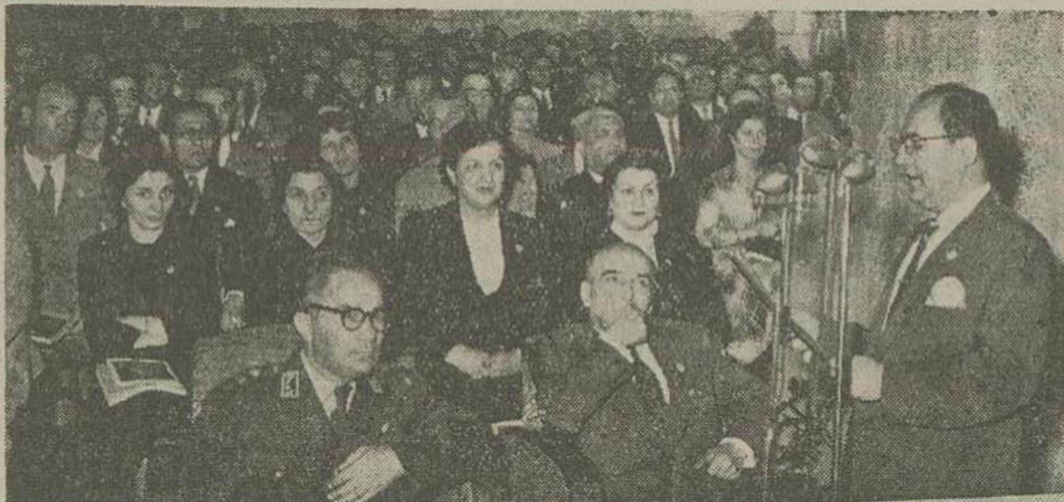
هماطور که دیروز اطلاع دادیم کنگره پزشکی روز دوشنبه در رامسر افتتاح شد و آقای دکتر صالح وزیر بهداشتی...

خیابان پاستور کاخ املاک پهلوی مراجعه نمایند تلفن ۴۴۰۹۶