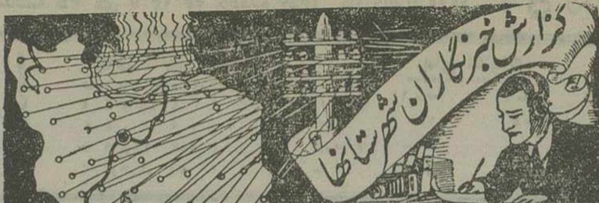
رشت - ۱۸ دی