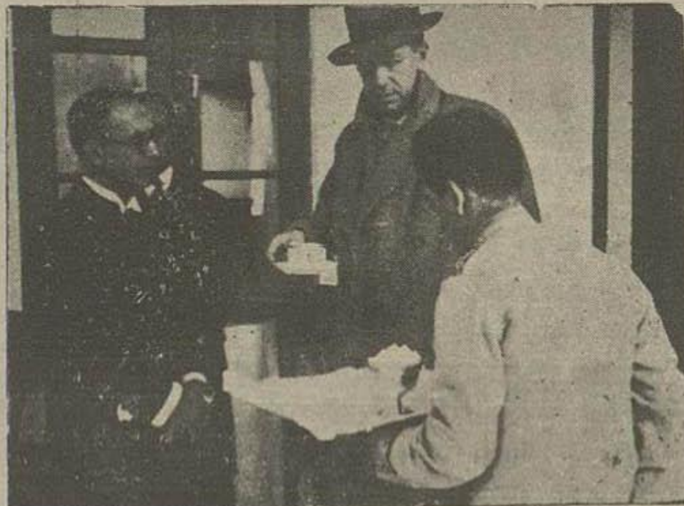
مراجعت والا حضرت از کارخانه سیمان