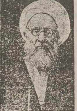
یکی دیگر از پیشوایان عالم روحانیت