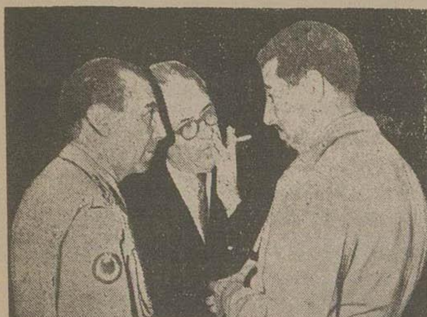
آقای سفیر وادسته نظامی سفارت ترکیه و یکی از مدهوبین بناسبت تصادف دیروز با جشن ارتش ترکیه از طرف آقای سرهنک کنان استیجین وایسته نظامی سفارت ترکیه در مجلس شایستی عصر دیروز در محل بیلابی سفارت ترکیه اقامه در شمران ترتیب داده شده بود که چندتن از آقایان وزیران و تیمسار سپهبدان در مجلس شایستی در شمران ترتیب داده شده بود که چندتن از آقایان و دژایی و هوایی و وادسته های نظامی سفارتخانه ها و چند تن از دیپلماتهای خارجی و عده ای از نمایندگان مجلسین و مدیران جراید با باوان خود در این شبانت دعوت داشتند.

جناب آقای علاء نخست وزیر طوریکه مقرر فرموده بودند برای بررسی اوضاع کارخانجات کشور و رسیدگی مشکلات آنها در تحقیق در باره علل بحران کنونی بازار کمیسیونی تشکیل و در جلسات متعدد طولانی و ضم کارخانجات نساجی و پشم بافی کشور از هر لحاظ همچنان اوضاع بازار نخ و قماش مورد مطالعه و تحقیق قرار گرفت. گزارش مشروح کمیسیون که حاوی نظریات و پیشنهاداتی است برای رفع بحران کنونی همچنین برای اصلاح اساسی امور صنعتی کشور اینک به پیوست تقدیم میگردد. متن درج این گزارش اثر فکر