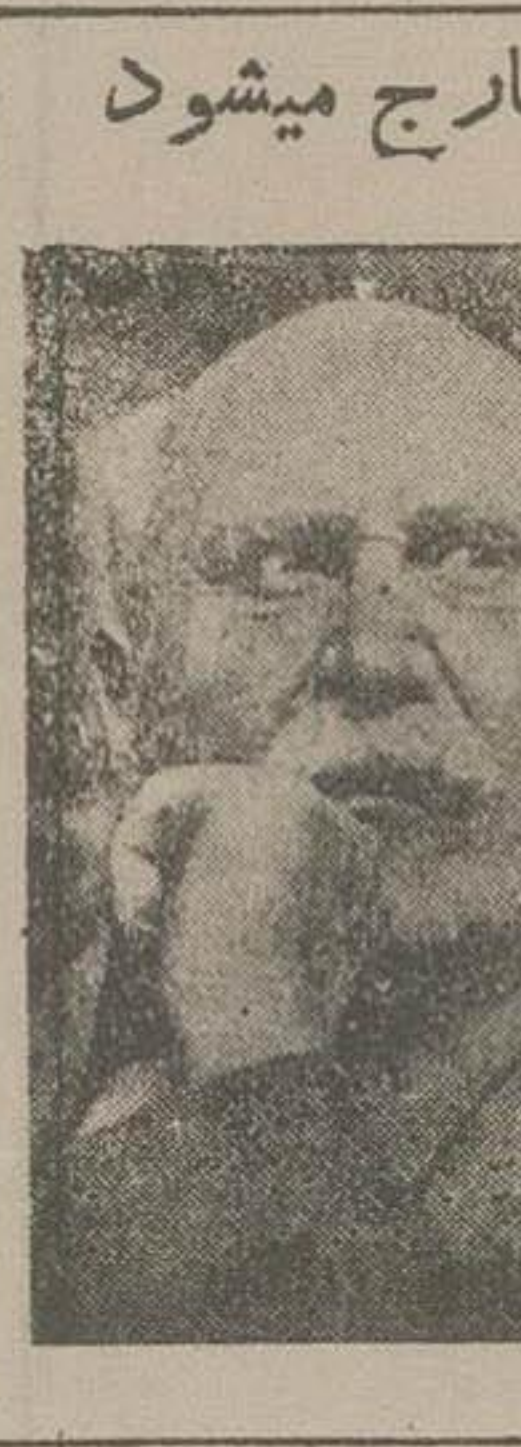
مارشال پتن از زندان خارج میشود