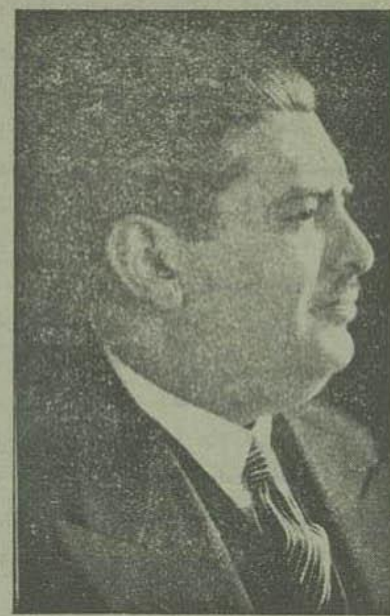
آقای عیانت الله سمعی وزیر امور خارجه