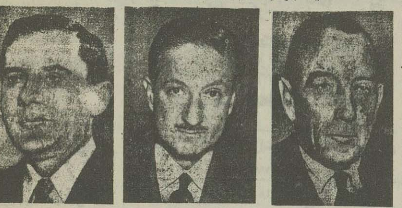
معاون وزارت خارجه شوروی - گروم - و سفیر امریکا در مسکو - کیرک - و رئیس مجسم عمومی سازمان - انتظام

سفیر امریکا در مسکو از دولت شوروی درباره پایان جنگ کرده توضیح خواست انتظام، مؤثرترین شخصیت برای پایان جنگ کرده است