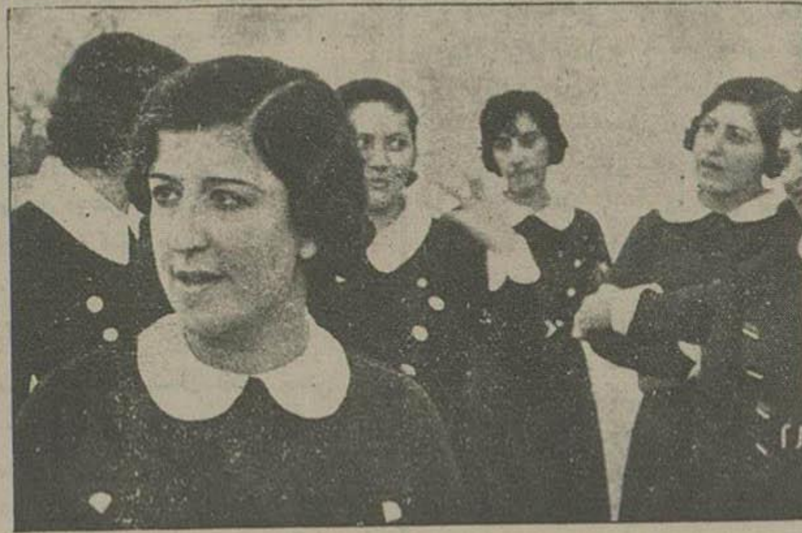
چند نفر از خانمهایی که هیئت رئیسه کانون بانوان را تشکیل میدهند. در جلو خانم تربیت مدیره کانون بانوان دیده میشوند که دیشب نظمی در کانون ایراد نمودند.