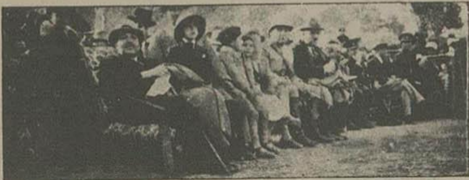
منظره از جمعیت مدعوین در صف جلو آقای حکمران اصفهان - آقای رئیس شهربانی - آقای رئیس معارف و عده از محترمین قرار دارند

بطوری که مخبر اداره از اصفهان اطلاع داده بود روز جمعه ۱۶ آبان جشن ورزش سالیانه دبیرستان ادب در اصفهان با حضور حکمران و کمیل فرماندهی تیب و روسای ادارات و محترمین تشکیل و مسابقه های ورزشی از طرف محصلین در روز مذکور بعمل آمده که جریان آن بنظر خوانندگان رسیده است اینک بطبع عکسهای واصله مبادرت می شود: