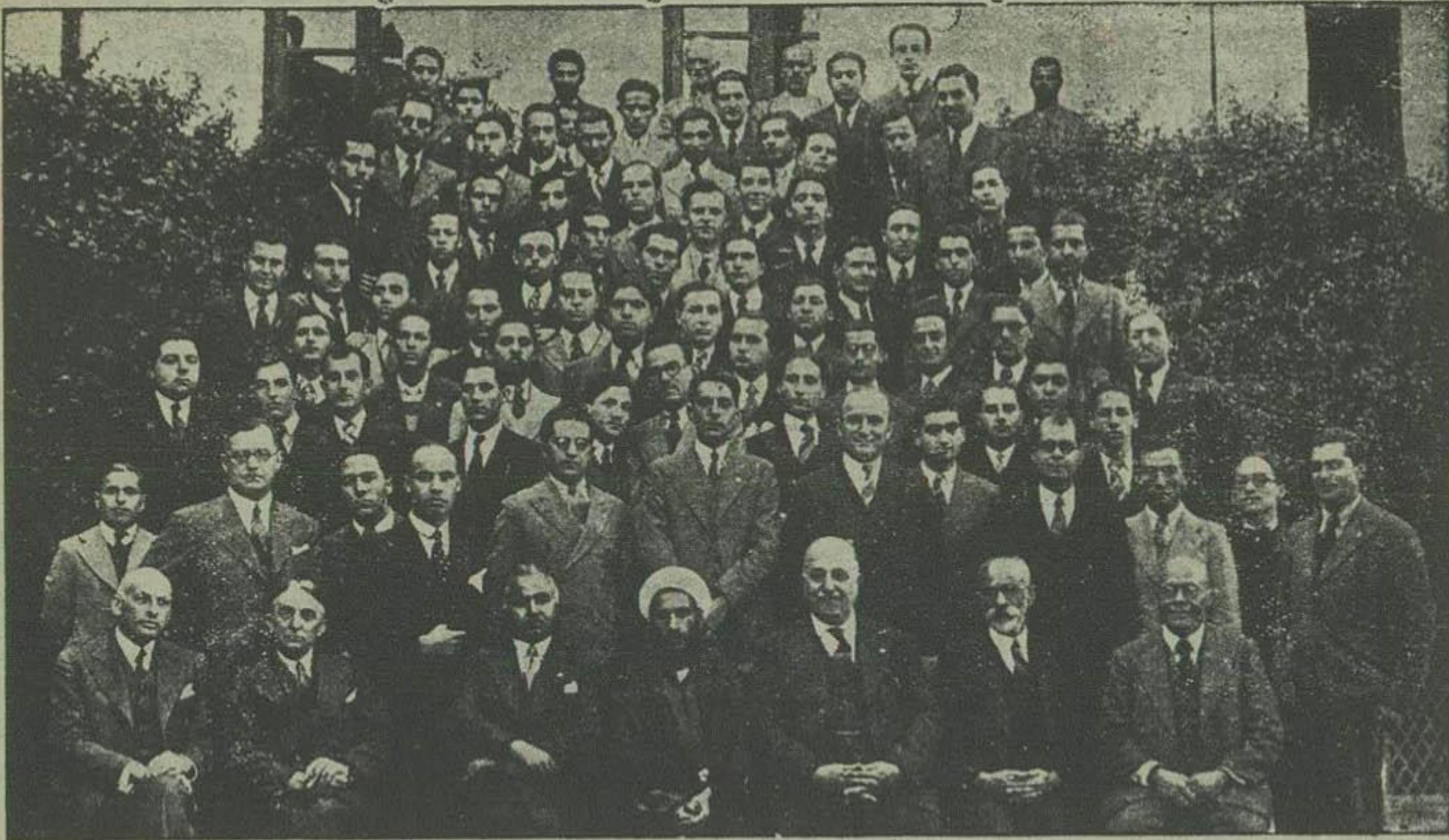
یکعده از لیسانسیه های دانشکده حقوق و سیاسی با استادان خود

میشود گفت این مصاحبه بطور تصادف صورت گرفت. يك مقدمت و سوابق قبلی از قبیل تعیین ساعت و وقت ملاقات نداشتند و در موقعی که آقای دکتر ربيع حكمت هالز حرکت بپیرز بودند که از آنجا بوطن عزیز خود تریه برود ایشان را در همان خانه عالی (گراند هتل) ملاقات کردم آقای دکتر ربيع حكمت از اهالی تریه و استاد دانشکده طب کابل و در استخدام دولت افغانستان هستند. از تعطیل تابستانی وایام مرخصی خود استفاده نموده. از راه ایران بترکیه عزیمت کرده اند. ایشان هنگام ورود به تهران موقتاً در هتل شمره و مسافرتی باصفهان و شیراز برای دیدن آثار تاریخی نوده و مجدداً به تهران بازگشته و روز جمعه گذشته از راه تبریز بترکیه عزیمت کردند. این خلاصه از مسافرت ایشان بایران میباشد و در ضمن صحبت اظهار داشتند که در دانشکده طب کابل سمت استادی دارند و این دانشکده درسال گذشته بیست و شش فارغ التحصیل بیرون داده و اکنون يك سال است که عده مذکور از طرف دولت افغانستان در ولایات افغان مشغول انجام وظیفه و صحت میباشند ایشان امیدوار بودند که برای سالی چند عده فارغ التحصیل های دانشکده هم بوزباد تریه و برای مبارزه با امراض مخصوصاً امراض سریشکلیات و سیم تری در افغانستان داده شود و متذکر شدند که حکومت افغان نسبتاً جدید زیادی برای پیشرفت و ترقی دانشکده مذکور میبذول می دارد