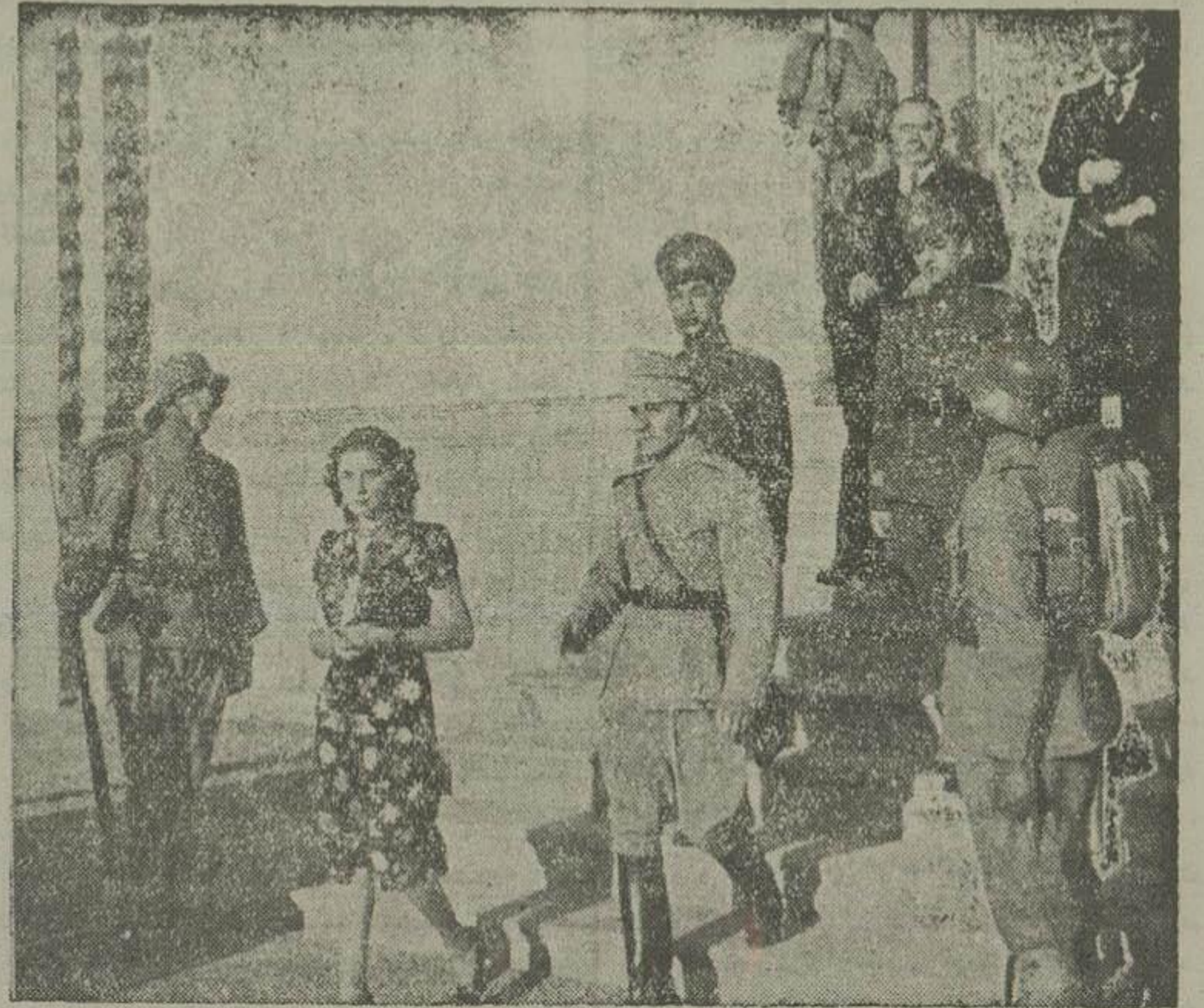
والاحضرت همایون ولایتعهد و والاحضرت همایون فوزیه پهلوی هنگام بارگشت از اسپرینس جلالیه والاحضرت شاهپور غلامرضا و والاحضرت شاهپور عبدالرضا نیز در مراسم اسب‌دوانی حضور داشتند