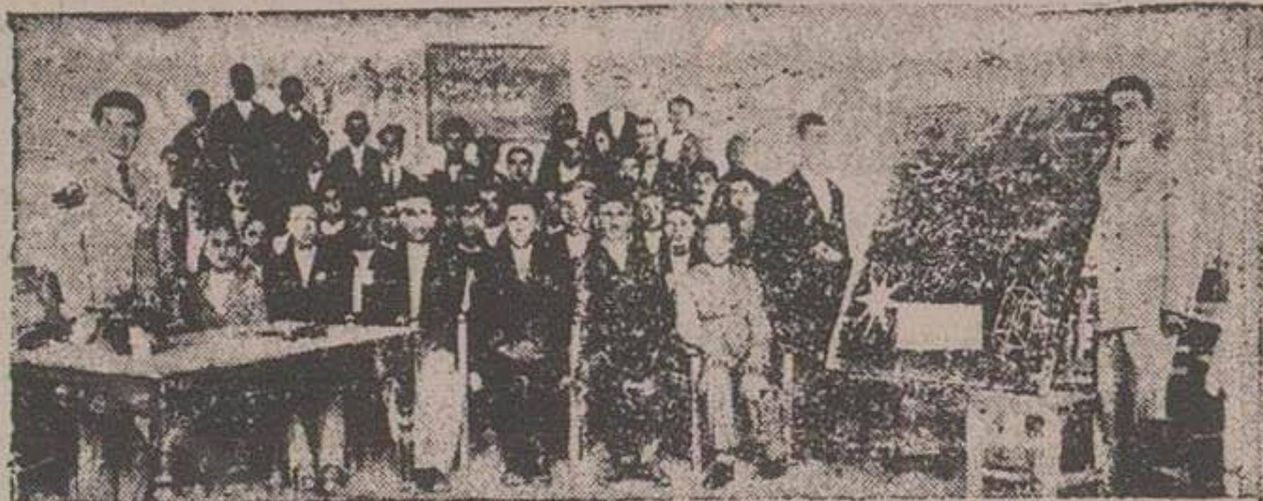
از نماینده اداره در همدان

دستال ۱۹۱۶ - بی شانزده سال پس از آنکه اول بدرود حیوة گفته بود درجه اجتهاد مریخ شناسی به وایلم بیکنرست متولد باسن رسید عالم مذکور بعد از لوئیس ارفارن ریازی را در رصداخانه عالم فقید صرف عکاسی و مطالعه مریخ کرده و سپس بتمام دنیا مسافرت کرد تا این که از ازمه جا نامتا کند و بالاخره آقدر مجذوب گردید که تمام اوقات خود را به مریخ شناسی از کذات نظر ایشانکه بیکنرست نمیخواست خود را