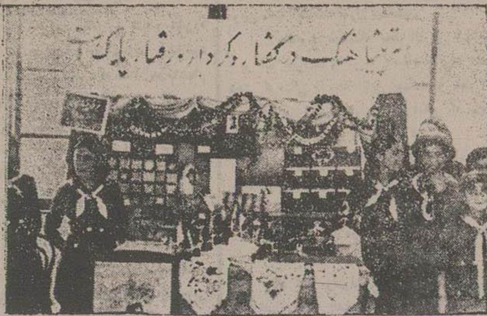
منظره از غرفه دختران پشاهنک رسد ۴۸ دبستان ایرج در عمارت موزه تهران

که پنجمین نامه از خمسه نظامی است پس از مقابله با سی نسخه که سال و تصحیح کامل و ترجمه بی نظیر اشعار بسا سی و زحمات آقای وحید دستگردی منتشر شد کتابخانه مؤسسه دانش خیابان صنیع الدوله تهران نمره اعلان ۱۶۲۹ ۱۰-۲