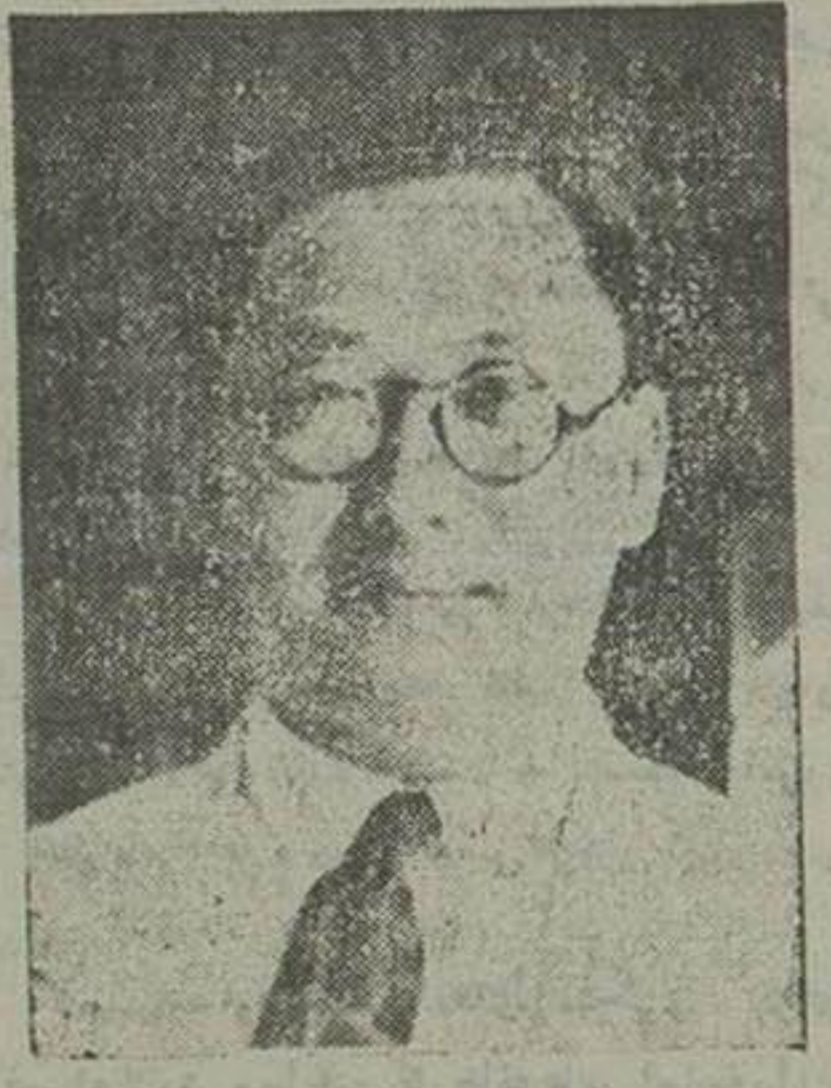
آقای ابراهیم مانینینک نایب رئیس هیئت مسلمانان چین