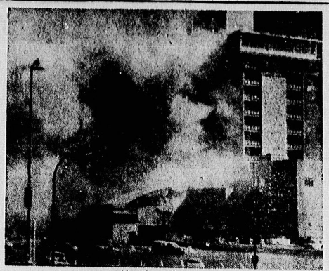
انبار در یکی از کازینوهای نزدیک لاس‌وگاس، چهارشنبه گذشته بمبئی در مجاورت زبوریت هتل، یکی از مراکز فحشاء در ایالت نوادا، منظره در شب و نمایی از آن ساختمان را با خاک پیکان کرد.

۱۰۰ میلیون دلار به توسعه صنایع و خدمات دولتی اختصاص داده شده است. ۲۰۰ میلیون دلار به توسعه صنایع و خدمات دولتی اختصاص داده شده است.