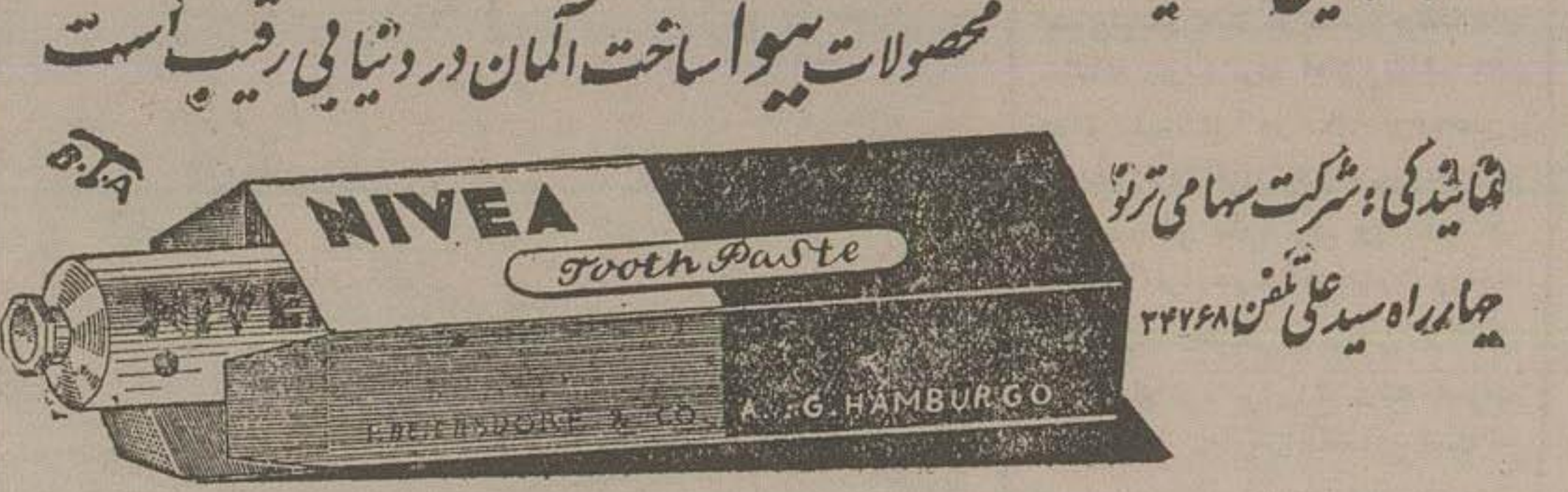
مصوبات نیوا ساخت آلمان در دنیای رقیب است

جوینده یابنده است بالاخره پس از مدت ها جوینده خمریزدان ایده آبی خود را پیدا کرده و از دست دزدانهای سالم و زیبا خوشامد شاهم یک بار خمریزدان نیوا را از بایش کنسید