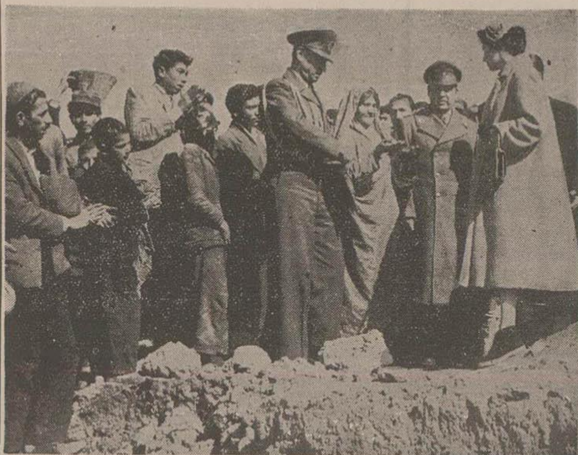
علیا حضرت در محوطه زاغه از زندگی زناغه‌نشینان استفسار می‌فرمایند