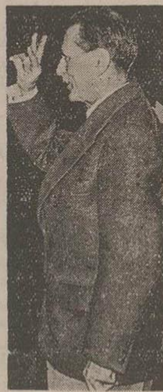
سلام پیشاهنگی نخست وزیر من قلبا جوانم

پیش در جشن آغاز چهارمین سال فعالیت سازمان هدایت جوانان که ریاست اختیاری آن آقای علاء دارد ایشان هنگام اعطای تقدیرنامه ها گفت: در جشن پیرم ولی قلبا جوانم و خود را در فعالیت جوانهای کشور برای ساختن ایران قوی و بهتری سهیم میدانم. پس از صرف چای مدعوبین سالن بزرگ جشن آغاز چهارمین سال فعالیت سازمان هدایت جوانان از ساعت شش بعد از ظهر بقیه در صحنه چهارم