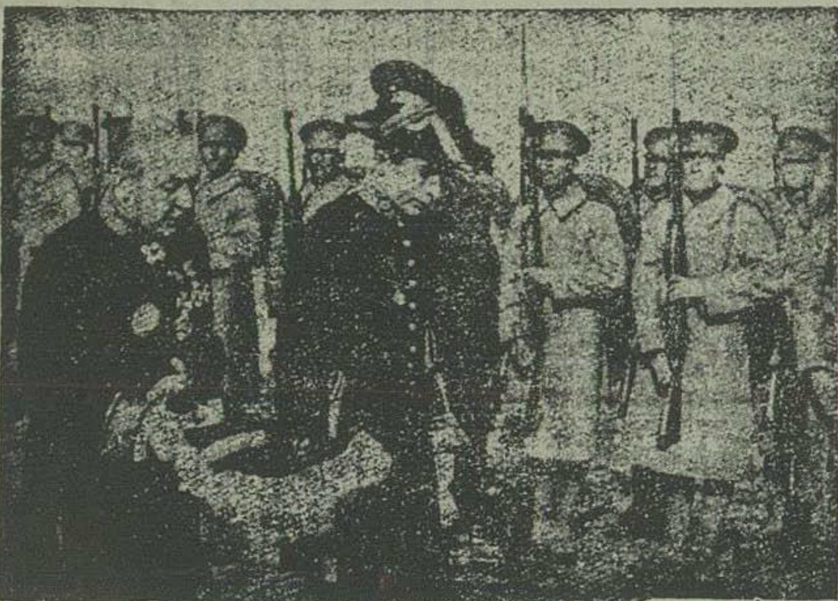
هنگام عبور از جلوی گارد احترام